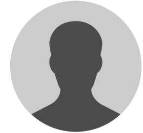
Представитель из системы здравоохранения Приморского края

Начальник отдела качества ЧУЗ "Клиническая больница "РЖД- МЕДИЦИНА" г. Уфа"